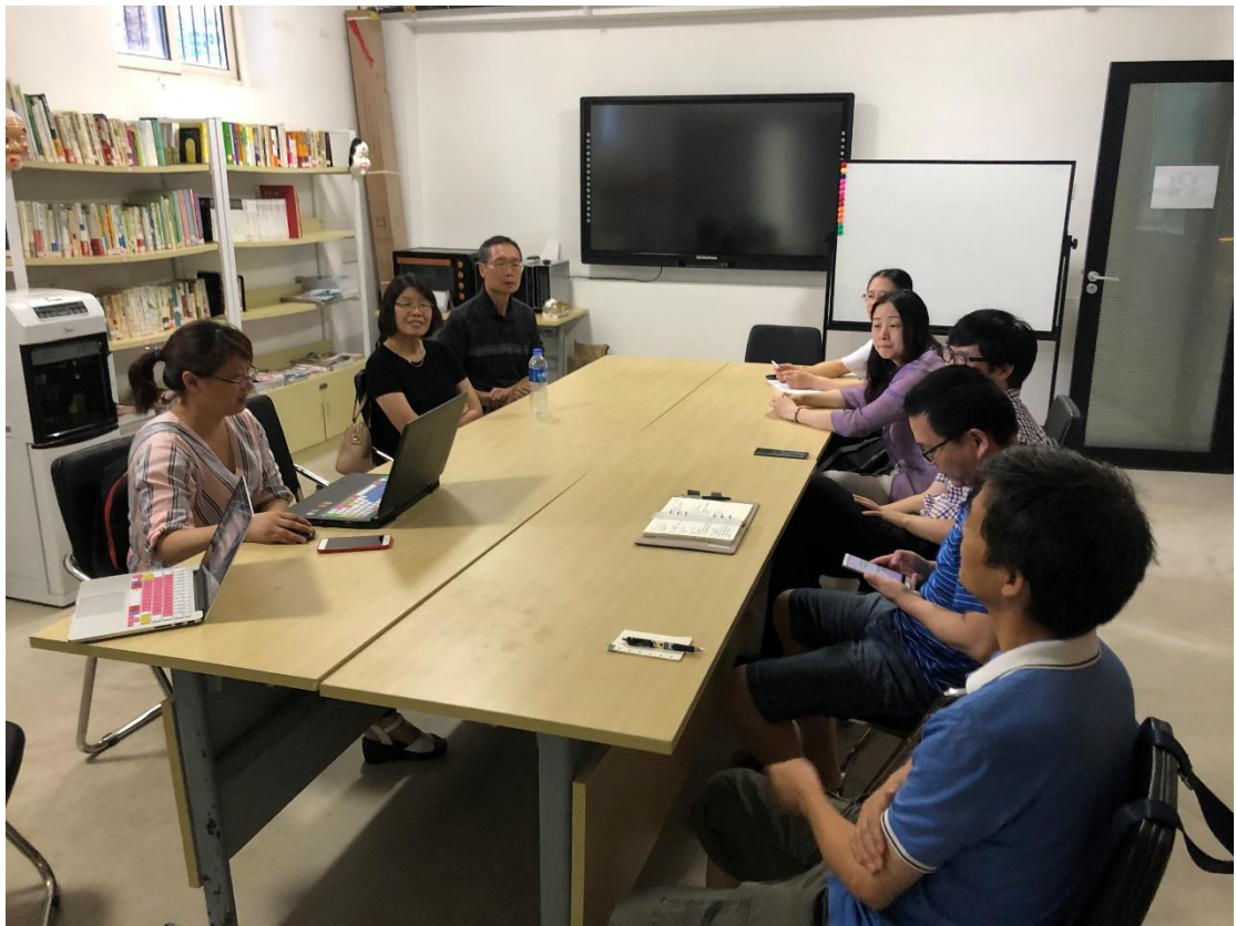
图 3.湖大教师听取陈教授意见